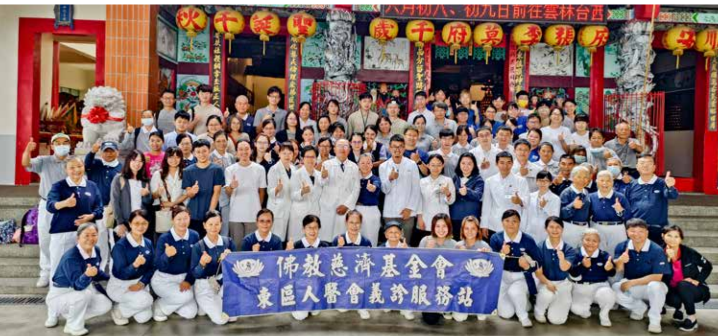
四月二十二日東區慈濟人醫會舉行太麻里義診，東部三家慈院的醫療人員與臺東區志工共約一百一十人團隊齊聚臺東歡喜付出。