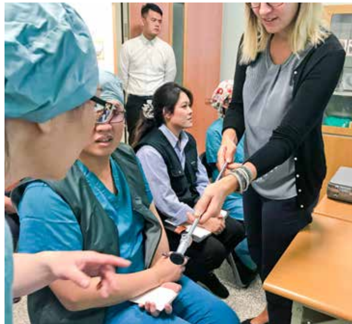
國際級技師操作示範指導腹腔鏡清潔保養。