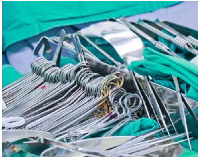
無菌器械陳列供外科醫師手術使用。

「他們是在手術團隊中扮演重要的後勤補給單位！像家裡的母親一樣，你需要什麼他們就會給你。」手術室主任林英超表示，器械供應及時與完整，對醫療團隊手術的流暢度與品質有一定影響。他指出台中慈濟醫院手術室與供應中心都以「病人為中心」的理念去完成任務，已成為手術室不可或缺的重要夥伴。