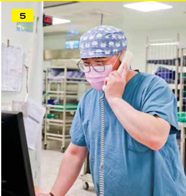
技術員接到手術室臨時器械需求電話，五分鐘內可將器械送達手術室。