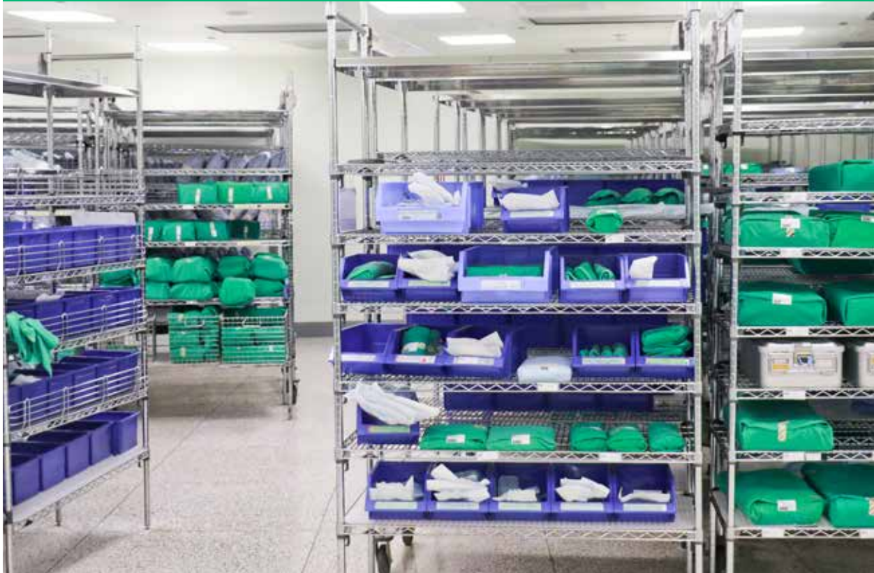
無菌包盤、醫衛材依照種類、科別、滅菌日期等規則性陳列儲存。