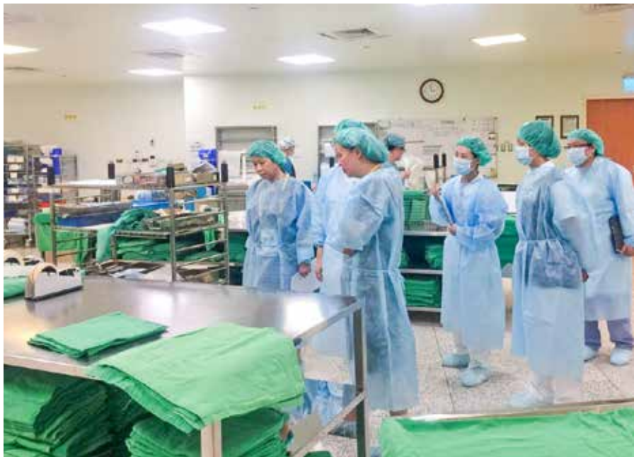
二〇一九年度「提升醫院供應中心醫療器材清潔消毒滅菌作業品質」評審委員實地訪查評鑑，台中慈院同仁陪評。