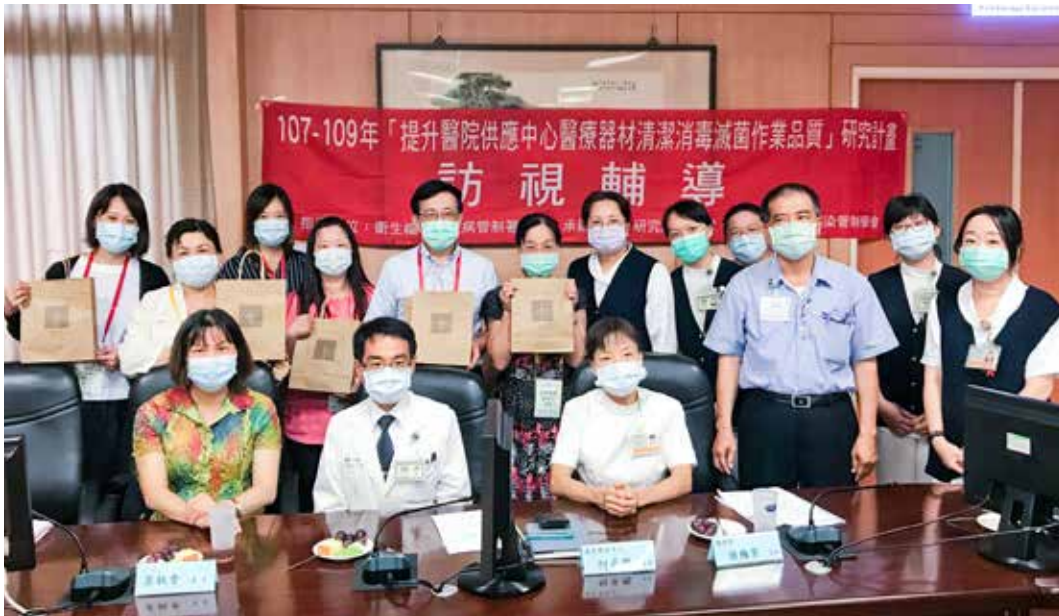
台中慈院陪評同仁與「提升醫院供應中心醫療器材清潔消毒滅菌作業品質」訪查委員合影。

視鏡設備等；病房區導尿管、換藥包、縫合包及無菌布等備品，採集中式管理模式，配發回收、清潔滅菌也皆由供應中心負責包辦。