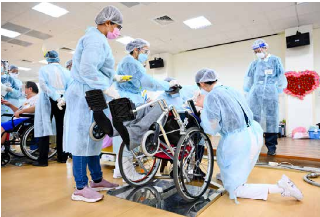
牙助與志工們調整姿勢或站或跪，為坐輪椅的病人進行洗牙服務。

有志之士加入義診行列。而人醫會的醫療設備一直在改良與提升，確實能造福諸多患者。」