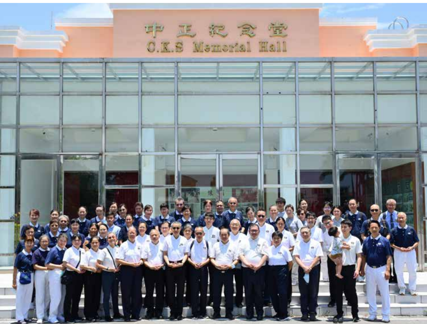
臺東兩日義診圓滿，人醫志工團隊互道感恩珍重，相約下次再聚。

憶及二〇一七年初來義診時，住民的健康情形和照顧環境都有改善空間，經過這幾年的努力，挺過疫情，此次來見褥瘡病人日漸康復，未再增加，衛教預防有效果，深感欣慰。兩日義診圓滿，人醫志工團隊互道珍重，相約十一月出隊再聚。🌱