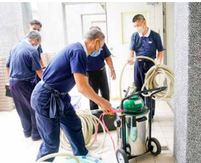
感恩管線志工團隊用心張羅洗牙義診上的器材設備與運作。

恐懼甚至反抗的情緒反應，為兼顧醫療品質與安全，人醫團隊以無比的耐心和愛心加以安撫，一一完成診療。在完成看診後，陸續見到志工推著住民的輪椅來到理髮區，由專業的義剪志工操刀打理門面。