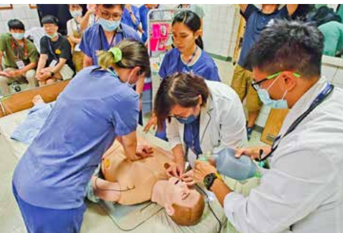
擬真情境訓練「新人組」的大林慈院醫護人員，執行病房情境訓練時著重團隊合作。

床技能，同時加強學習醫療團隊合作與溝通技巧，優化臨床照護技能並提升醫療品質，讓民眾就醫時相對安心與放心。「醫海無涯，惟獨練習是岸」，唯有不斷重複演練，才能不愧對病人及良心，此外，不論「痛苦或美好」，前人的醫護處置經驗，皆可成為其他醫護的知識及技能，一回生，二回熟，就可熟能生巧，找到「撇步」竅門。擬真情境訓練是最適宜的教學工具。