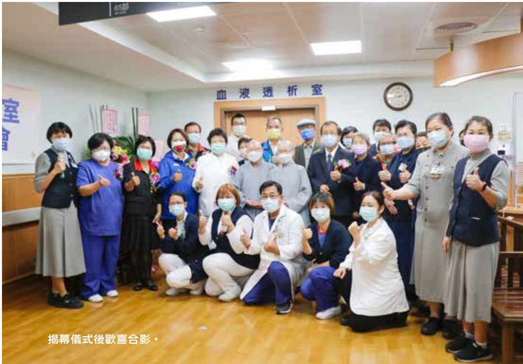
揭幕儀式後歡喜合影。