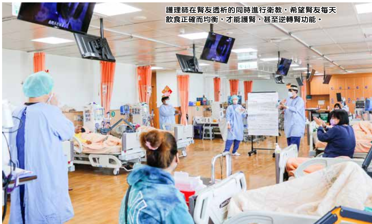
護理師在腎友透析的同時進行衛教，希望腎友每天飲食正確而均衡，才能護腎，甚至逆轉腎功能。