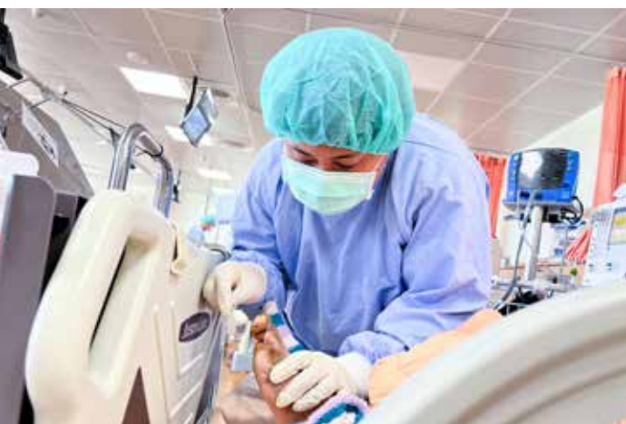
透析室的護理同仁應用所學，用心於臨床服務，照顧好每一位病人。