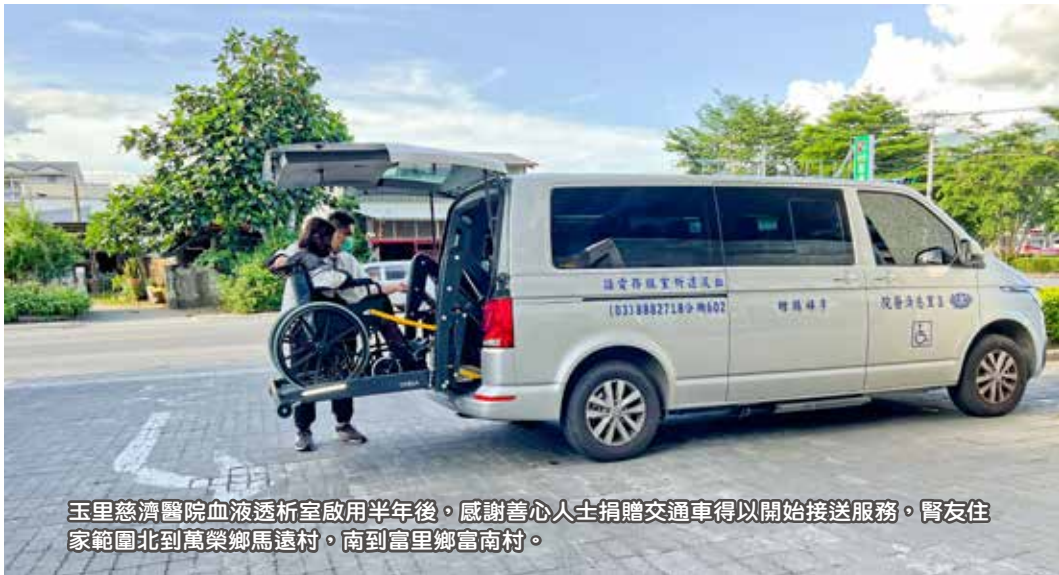
玉里慈濟醫院血液透析室啟用半年後，感謝善心人士捐贈交通車得以開始接送服務。腎友住家範圍北到萬榮鄉馬遠村，南到富里鄉富南村。