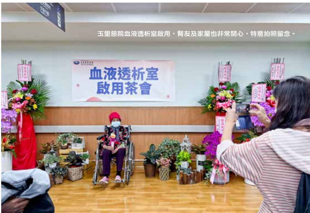
玉里慈院血液透析室啟用，腎友及家屬也非常開心，特意拍照留念。