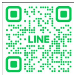
慈濟環保輔具 LINE 掃 QR CODE 點選 加入好友

之於輔具服務的意義，彭振維形容：「送輔具，只需要十分鐘、二十分鐘或三十分鐘的運送過程，但就像證嚴上人說的『滴水成河，粒米成籬』，一點點時間的付出，在時間的長河裡，就能成就菩提。」